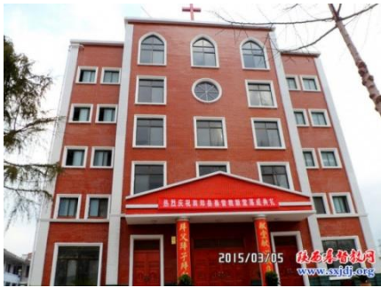
Nanzheng Amt Hanzhong City, Shaanxi-provinsen, indviet den 9.marts 2015