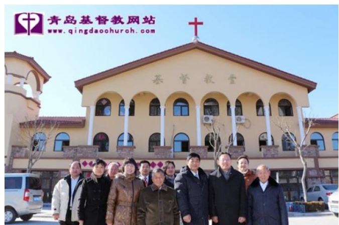
Houjin Church, Qingdao City, Shandong Province, Jan.1,