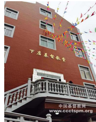
Xiadian Church, Fuqing City, Fujian Province indviet Feb. 27