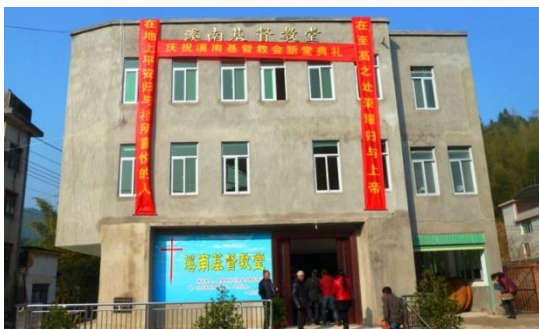
Xinan Town Church,Zhangping City, Fujian Province Jan. 17,